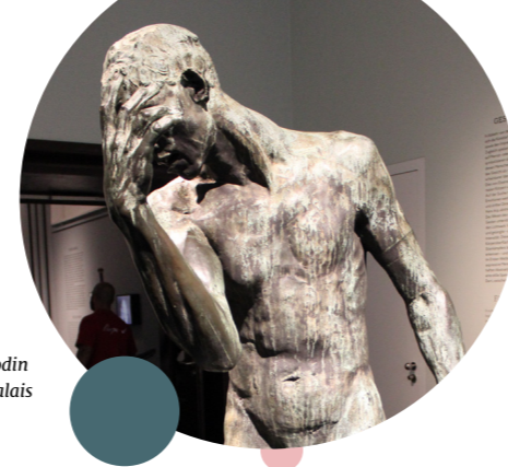
Eine Studie von Auguste Rodin zu einem der Bürger von Calais

Drei der Mädchen wollen zu Medusa recherchieren. Sie ziehen los in den dunkel gestalteten Ausstellungsraum, das Klemmbrett in der Hand. Ein Mädchen hakt sich bei einem anderen unter, auf deren Pulli in großen Buchstaben „Support your mental health“ prangt – eine eindeutige Botschaft. Das andere Mädchen und einer der Jungs entscheiden sich für Athene, während der zweite Junge sich