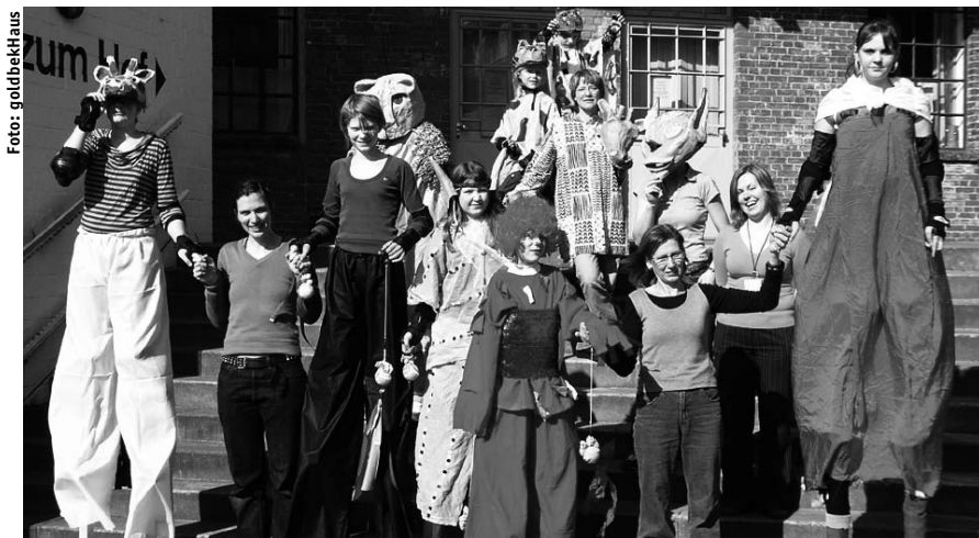
Die Kinder und Jugendlichen fertigten die Kostüme und Stelzen gemeinsam mit Eltern und Betreuer/innen

Kontakt: Kinderbuchhaus im Altonaer Museum, Museumstraße 23, 22765 Hamburg, 040 / 42 81 35 – 15 43, kinderbuchhaus@gmx.de