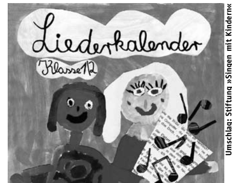
Deckblatt des neuen Liederkalenders für die Klassen 1 / 2

Kontakt: Landesmusikrat Hamburg e. V., Mittelweg 42, 20148 Hamburg, 040 / 645 20 69, info@landesmusikrat-hamburg.de , www.landesmusikrat-hamburg.de