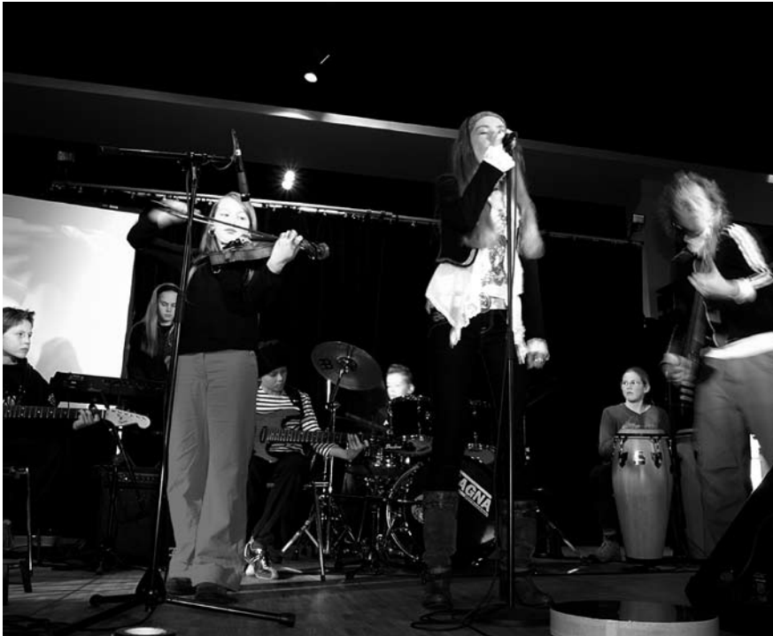
Die Musik zur Hörspielproduktion wird von Schülerband des Freien Kinder & Musik Ateliers eingespielt

Eine wunderschöne Hörspielproduktion von und mit Kindern produzierte die MOTTE in Kooperation mit Mirko Frank und der Schülerbande des Freien Musik Ateliers, Schnittpunkt e. V. und dem Altonaer Museum.