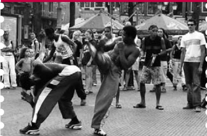
Frevo-Tänzer in Brasilien auf der Straße

Um die Begeisterung fortzusetzen, ist geplant, Frevo und andere brasilianische Tänze ab dem kommenden Schuljahr an verschiedenen Hamburger Schulen anzubieten. Das Projekt beinhaltet klassenübergreifendes Tanzen und die Förderung von stadtteilübergreifenden Kontakt. Die Kostüme werden alleine geschneidert und gemeinsam der Wagen für den Umzug geschmückt.